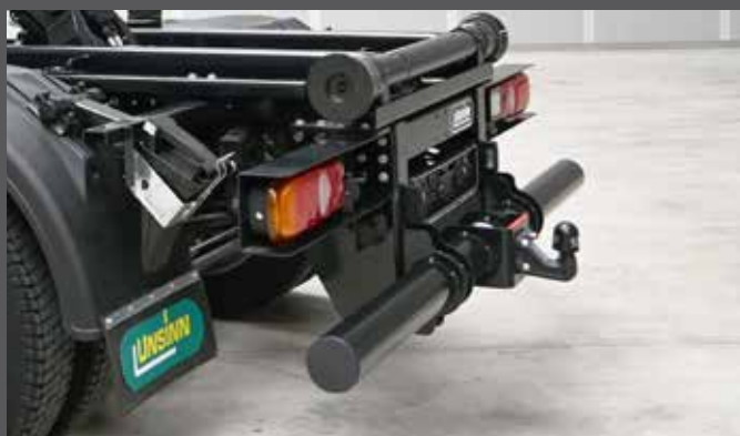
Heckunterfahrerschutz mit Kugelkopfkupplung