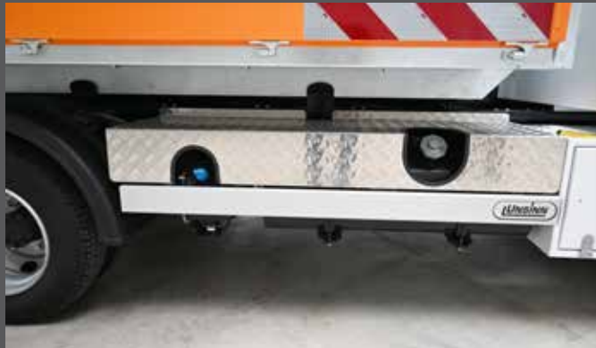
Schutzabdeckung über dem Tank