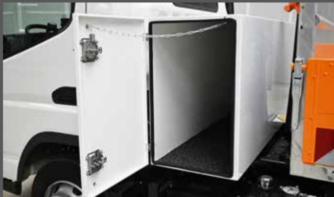
Systemschrank hinter dem Fahrerhaus